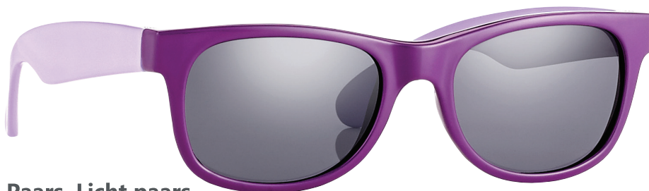
Paars, Licht paars art.nr. 16601 maat 44