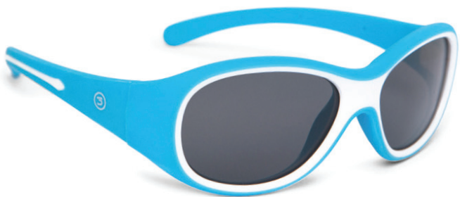
Lichtblauw art.nr. 8817 01 maat 49