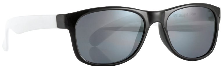
Glanzend zwart, Wit art.nr. 16854 maat 46