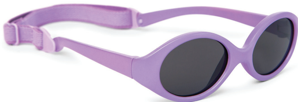
Lila art.nr. 8807 02 maat 38