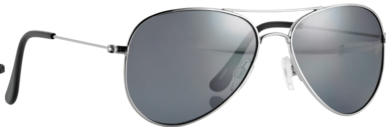
Zilver art.nr. 16832 maat 52