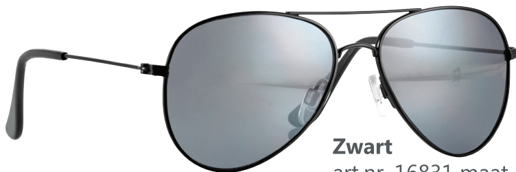
Zwart art.nr. 16831 maat 52

Assortiment: 4 stuks (2 per kleur/per maat) art.nr. 16830