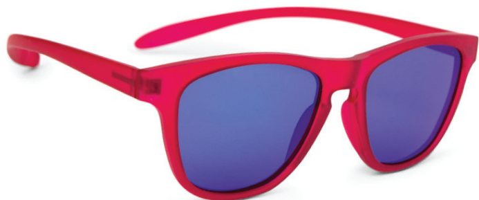
Rood met blauwe verspiegeling art.nr. 8814 11 maat 46 art.nr. 8814 01 maat 48