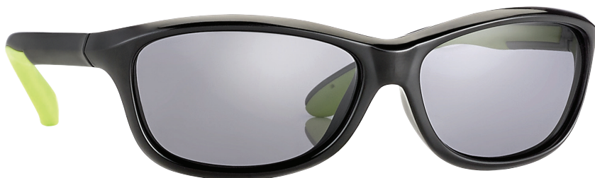
Zwart, Groen art.nr. 16968 maat 52