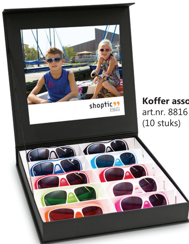
Koffer assortiment* art.nr. 8816 98 (10 stuks)

100% UV- bescherming voor alle kinder- zonnebrillen