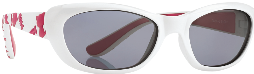
Wit, Fuchsia art.nr. 16946 maat 51