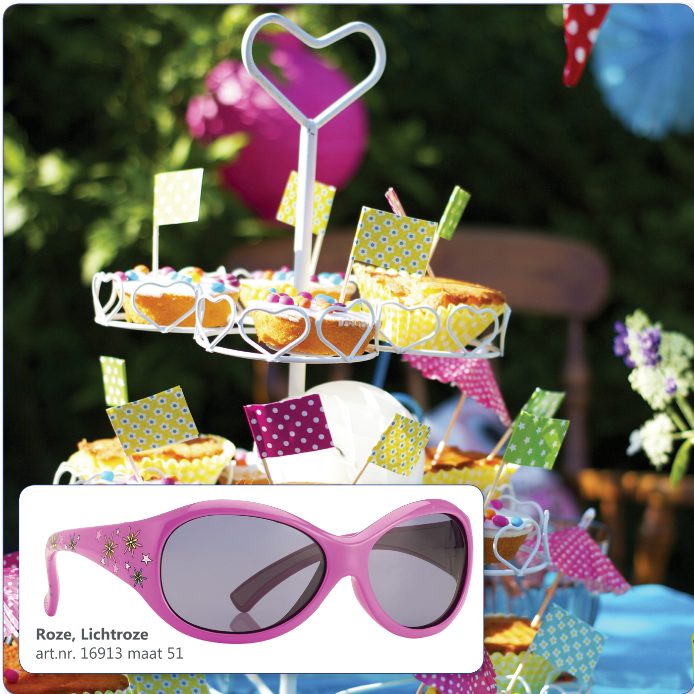
Roze, Lichtroze art.nr. 16913 maat 51