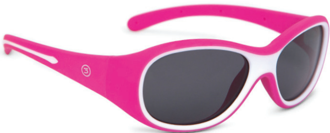
Roze art.nr. 8817 03 maat 49