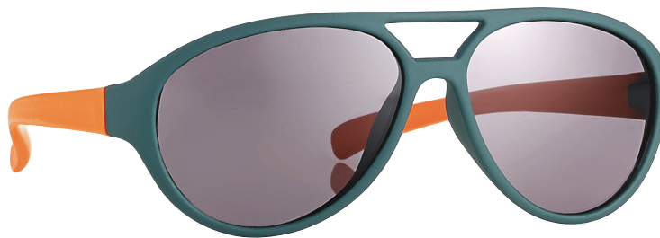
Donkergroen, Oranje art.nr. 16992 maat 44

Assortiment: 6 stuks (2 per kleur/per maat) art.nr. 16990KIT