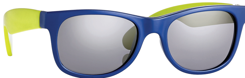
Blauw, Lichtgroen art.nr. 16602 maat 44