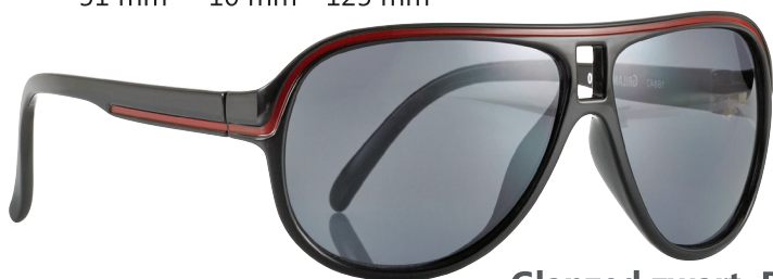
Glanzed zwart, Rood art.nr. 16842 maat 51

Assortiment: 4 stuks (2 per kleur/per maat) art.nr. 16840