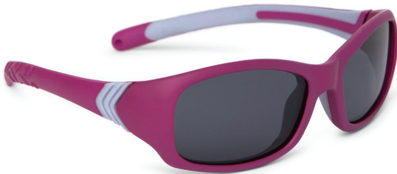
Roze, Grijs art.nr. 8812 02 maat 47