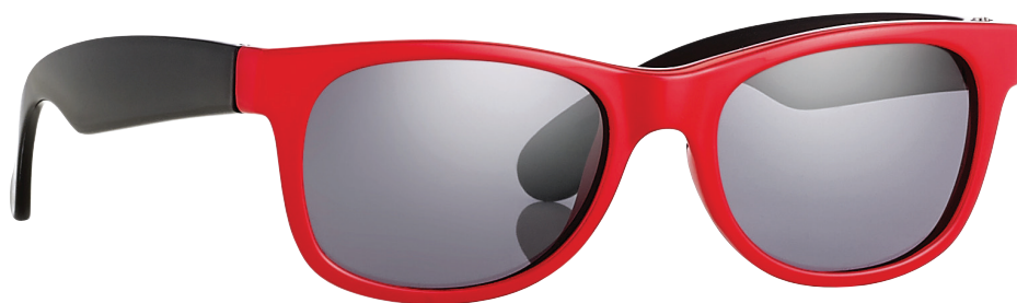
Rood, Zwart art.nr. 16600 maat 44