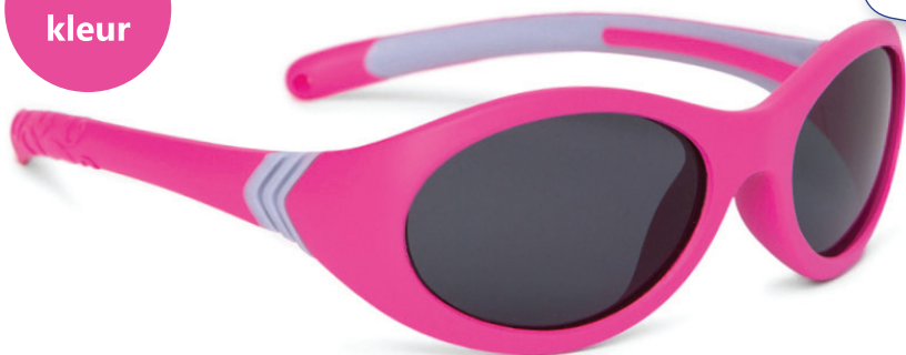
Neonroze, Grijs art.nr. 8810 06 maat 46