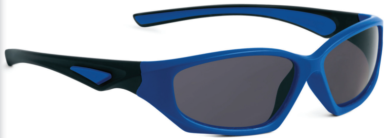
Blauw, Zwart art.nr. 8813 00 maat 54