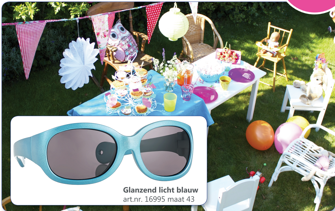
Glanzend licht blauw art.nr. 16995 maat 43