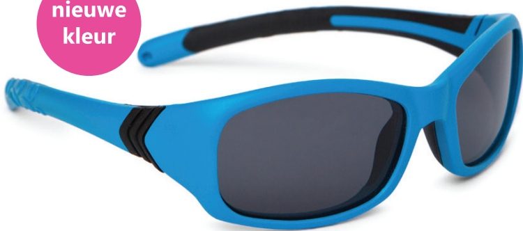
Neonblauw, Zwart art.nr. 8812 05 maat 47