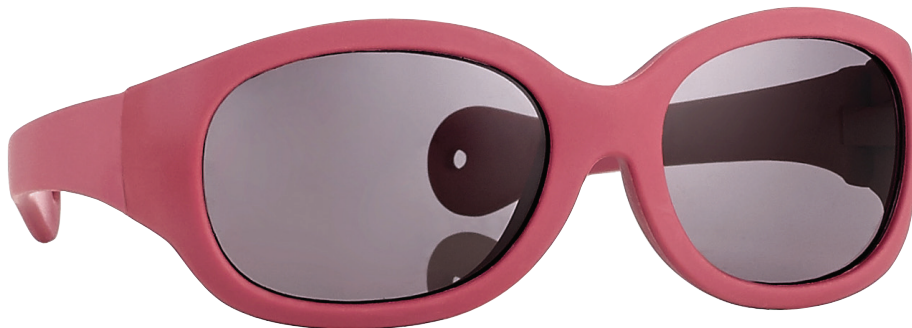
Mat rood art.nr. 16998 maat 43