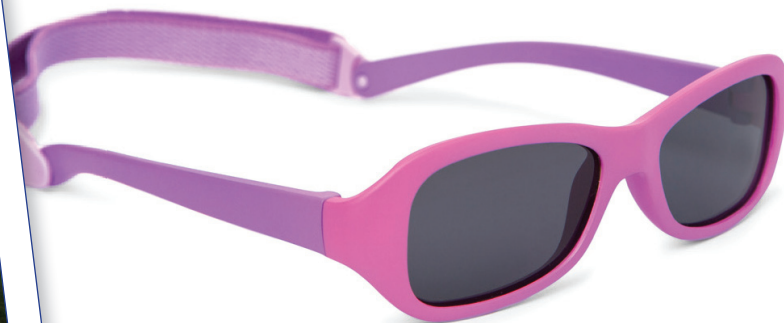
Roze, Lila art.nr. 8809 01 maat 43