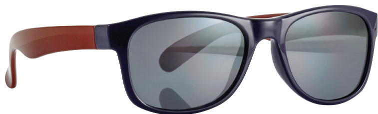
Glanzed blauw, Rood art.nr. 16851 maat 46

Assortiment: 8 stuks (2 per kleur/per maat) art.nr. 16850