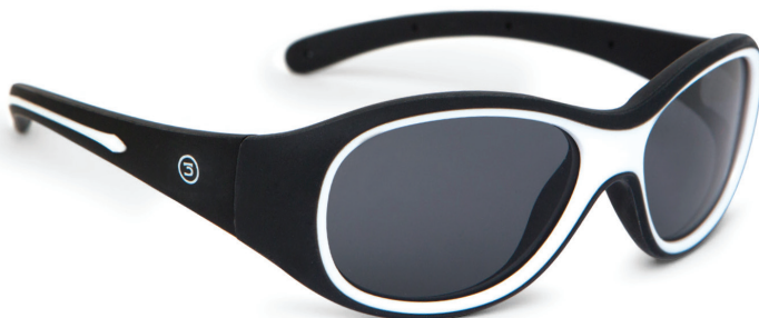
Zwart art.nr. 8817 00 maat 49