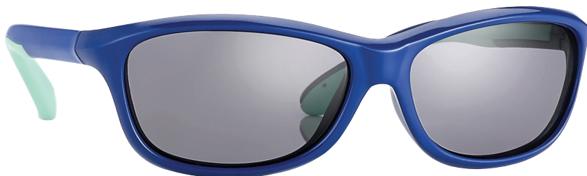
Donkerblauw, Aqua art.nr. 16966 maat 52