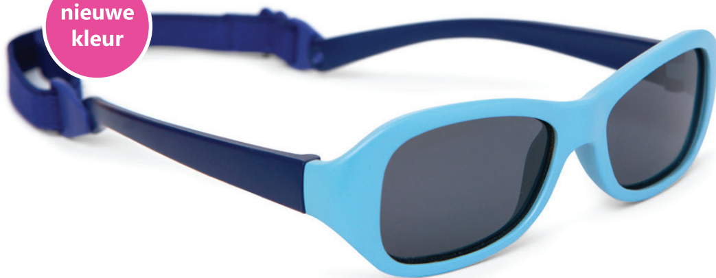
Lichtblauw, Blauw art.nr. 8809 04 maat 43