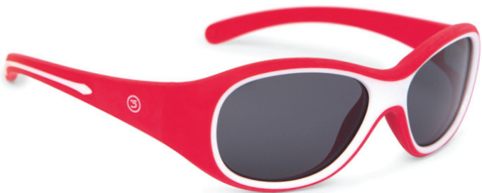
Rood art.nr. 8817 02 maat 49