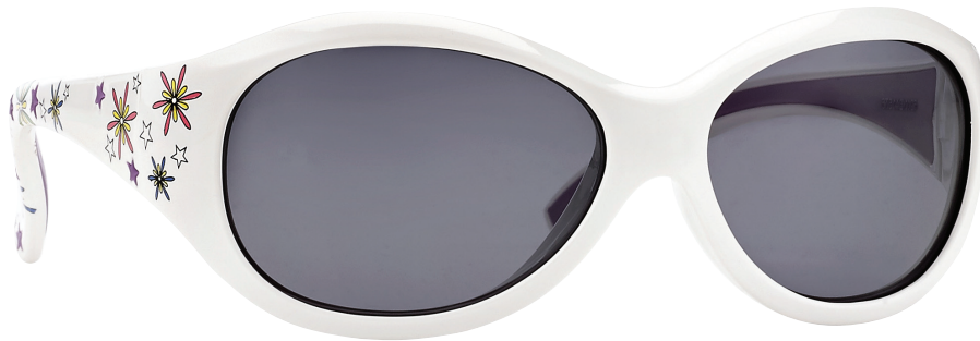
Wit, Donkerpaars art.nr. 16911 maat 51

Assortiment: 6 stuks (2 per kleur/per maat) art.nr. 16910