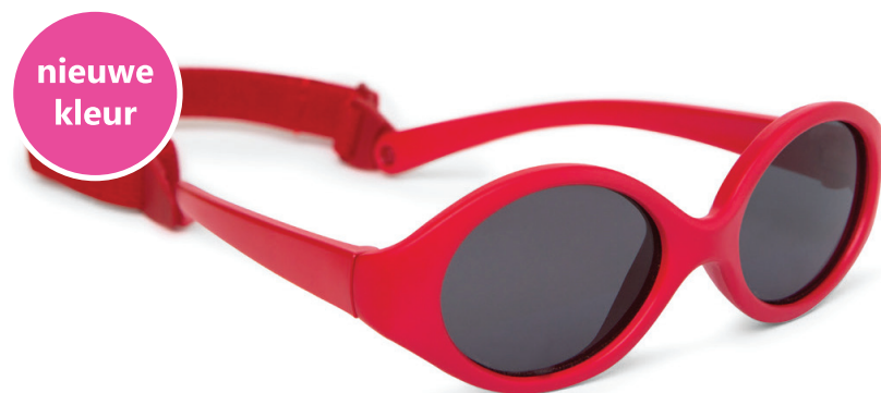
Rood art.nr. 8807 05 maat 38