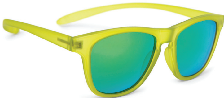
Lichtgroen met groene verspiegeling art.nr. 8814 13 maat 46 art.nr. 8814 03 maat 48