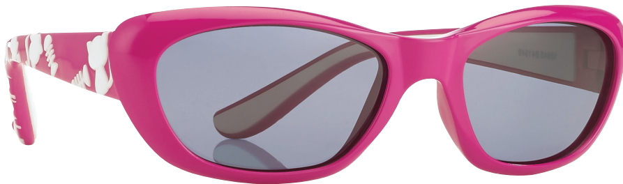
Fuchsia, Wit art.nr. 16945 maat 51

Assortiment: 4 stuks (2 per kleur/per maat) art.nr. 16945KIT