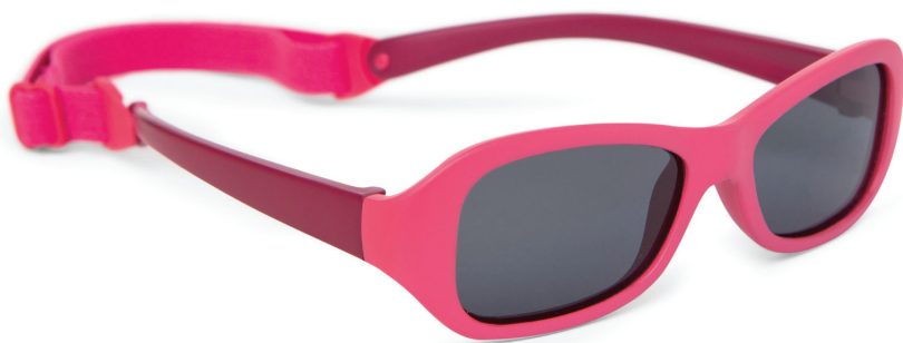
Rosé, roze art.nr. 8809 00 maat 43