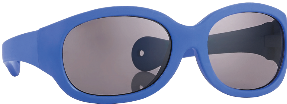
Mat donkerblauw art.nr. 16997 maat 43