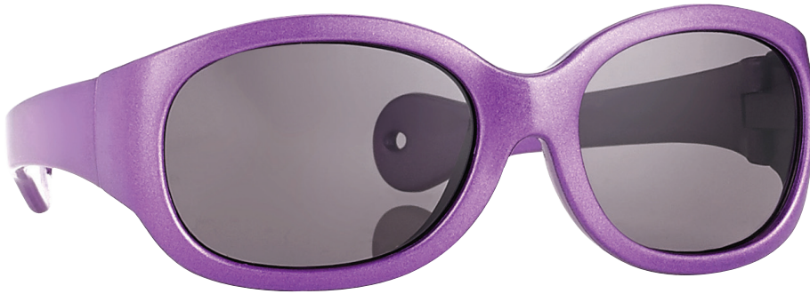
Glanzend fuchsia art.nr. 16996 maat 43