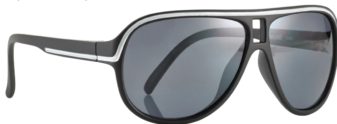
Mat zwart, Wit art.nr. 16841 maat 51