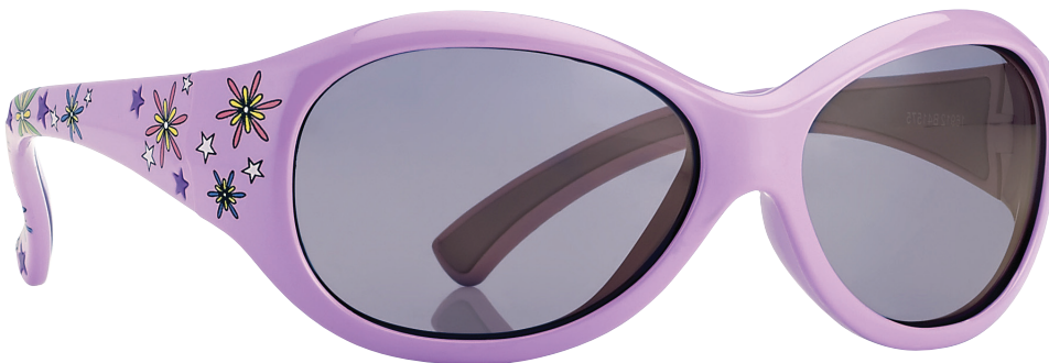
Lichtpaars, Donkerpaars art.nr. 16912 maat 51