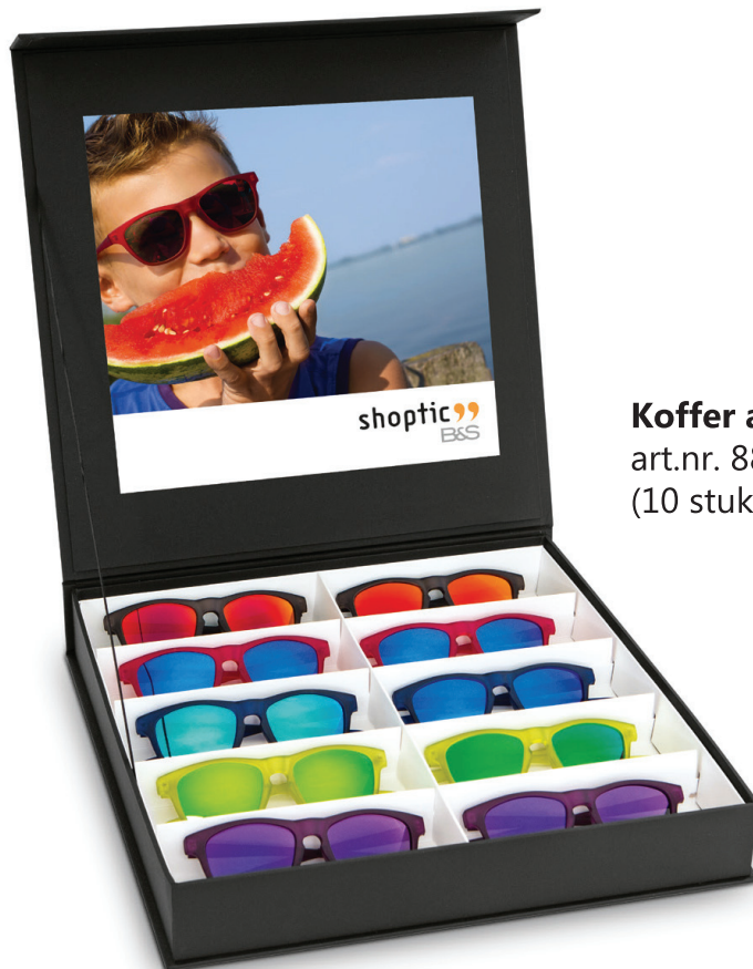
Koffer assortiment* art.nr. 8814 99 (10 stuks)