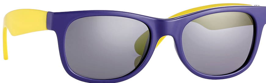
Paars, Geel art.nr. 16603 maat 44