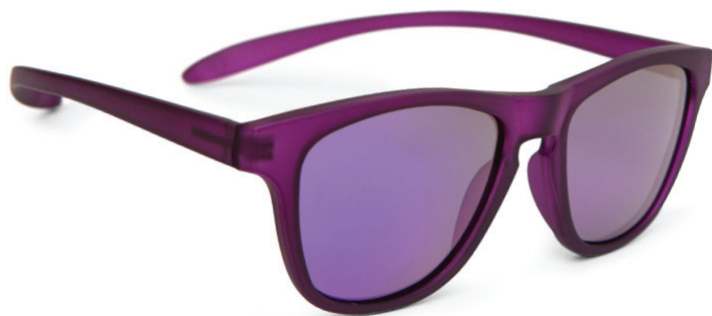
Lila met lila verspiegeling art.nr. 8814 14 maat 46 art.nr. 8814 04 maat 48