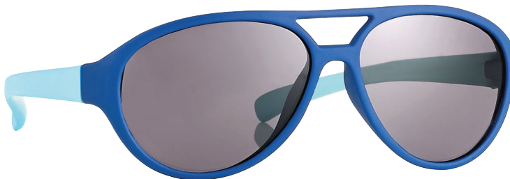
Donkerblauw, Lichtblauw art.nr. 16990 maat 44