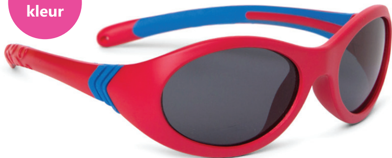
Rood, Blauw art.nr. 8810 05 maat 46