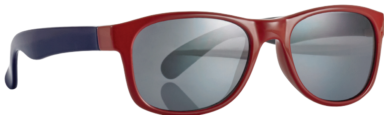
Glanzend rood, Blauw art.nr. 16852 maat 46