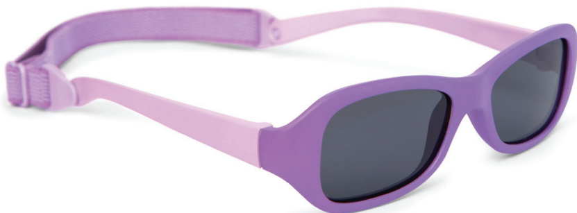
Lila, Lichtroze art.nr. 8809 02 maat 43