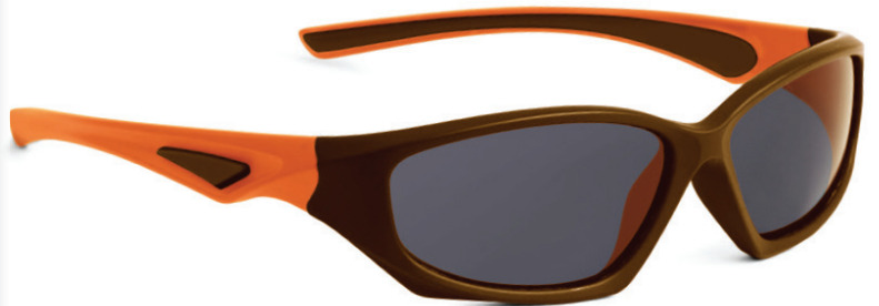
Bruin, Oranje art.nr. 8813 03 maat 54 35