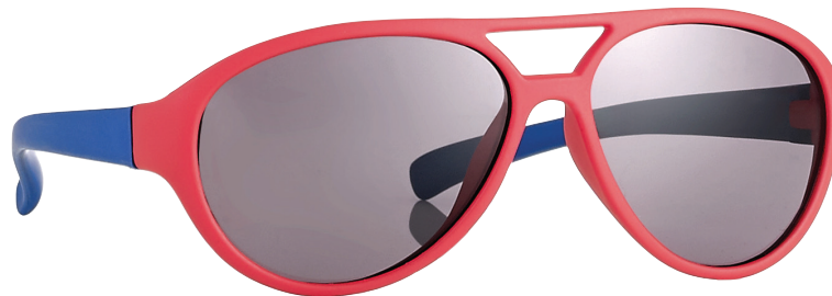
Rood, Blauw art.nr. 16991 maat 44