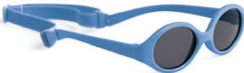
Lichtblauw art.nr. 8807 03 maat 38