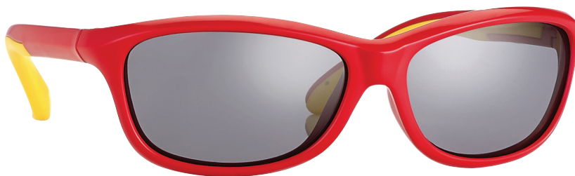
Rood, Geel art.nr. 16967 maat 52